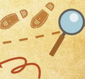
學生展示故事延伸 寫作活動作品