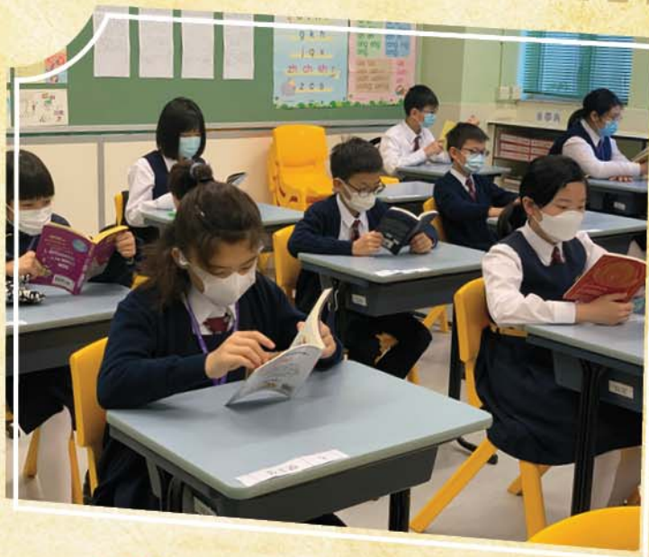
透過《小偵探訓練所》活動，提升學生的邏輯思維能力