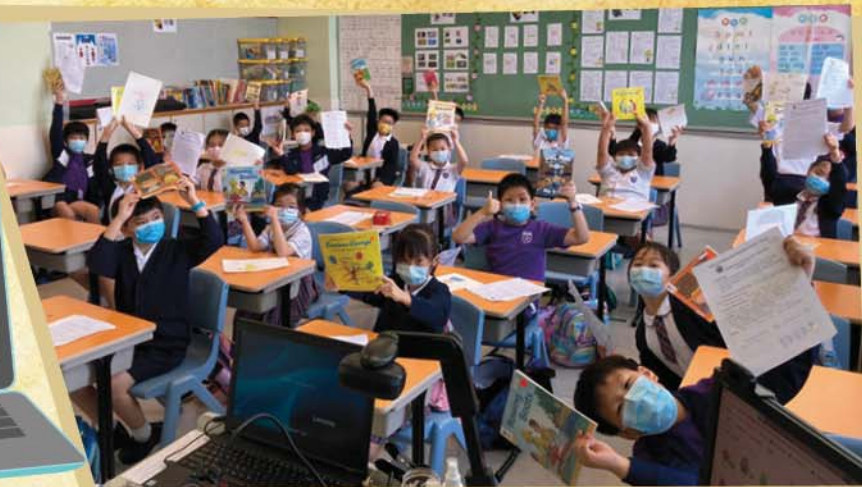
學生分享自己喜愛的中、英文圖書