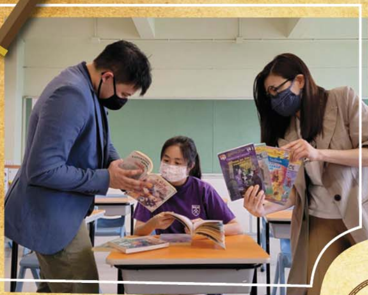
教師利用戲劇宣傳主題閱讀活動