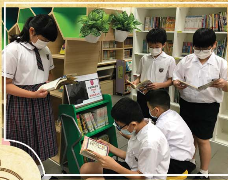
學生在圖書館聚精會神地閱讀偵探推理圖書