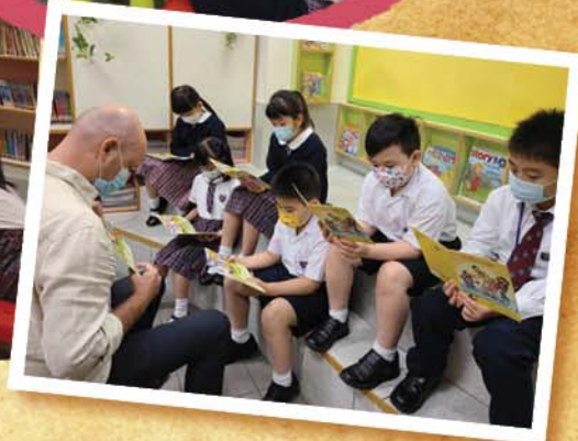
三位外籍英語老師與學生分享有趣的英文好書