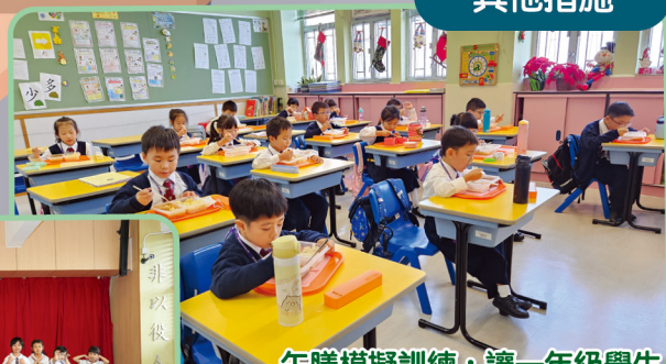
午膳模擬訓練，讓一年級學生學習在校午膳