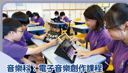
音樂科：電子音樂創作課程