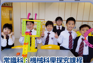
常識科：機械科學探究課程