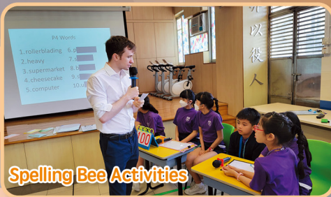
Spelling Bee Activities