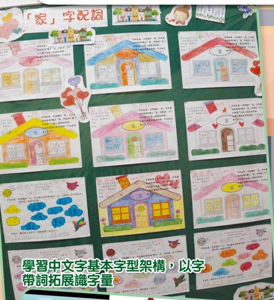
學習中文字基本字型架構，以字帶詞拓展識字量