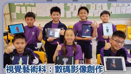
視覺藝術科：數碼影像創作