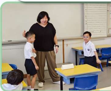
透過遊戲讓學生學習小學課堂的常規及守則

八月份的適應活動讓學生認識老師及新同學，提升學生社交技巧，減低對新環境的憂慮，增加對學校的歸屬感。