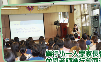
舉行小一入學家長會，讓家長了解學校運作，並與老師進行會面溝通