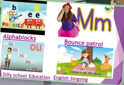
學習英語發音技巧，打好學習基礎

多元化的小息活動，包括照顧課室盆栽、Reading Café 英文活動、STEM@PE、Art Jam、午間卡拉OK、圖書館活動、棋藝、創科教室等，讓學生在小息有不同的體驗，增加與同學之間的互動及聯繫。