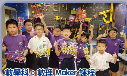
數學科：數理 Maker 課程