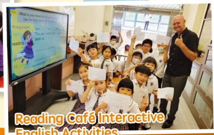
Reading Café Interactive English Activities