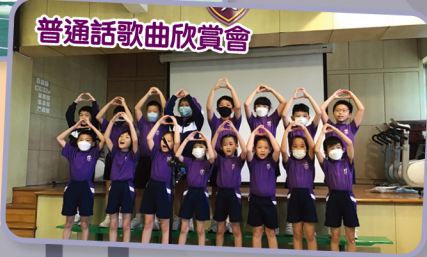
普通話歌曲欣賞會