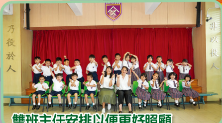
雙班主任安排以便更好照顧每一位小一學生