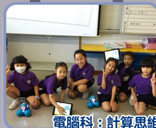
電腦科：計算思維及程式編寫課程