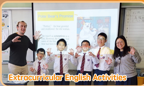
Extracurricular English Activities