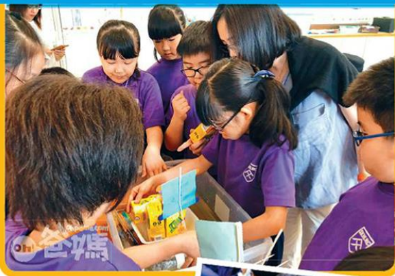
●三年班的小朋友以海為主題，他們正在進行實驗，到底如何設計一架船才能盛載着最多的「檸檬茶」而又不沉。

學校學生升中情況理想，根據校方公佈的包括升讀聖保羅男女中學、庇利羅氏女子中學、聖馬可中學、英皇書院及英華女學校等。而學校小一叩門位大約有8個，但要視乎實際情況，例如有沒有家長不註冊，或有沒有留班生等。(詳細文章： http://www.ohpama.com/436630 )