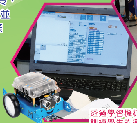
透過學習機械人編程訓練學生的邏輯思維

六年級同學先透過動手操作和程式編寫學會使用蜂鳴器、LED燈、重複指令，再學習用無線連接控制機器人，並以鍵盤控制前進、後退及多層式條件指令，最後以小組形式合力編寫程式避過簡單障礙及命令機械人巡線。在編寫程式中，學生不斷自行測試和修正問題，以培養他們的解難能力和運算思維能力。