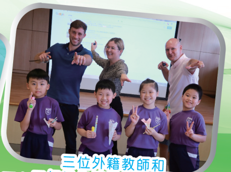
三位外籍教師和 一、三年級飲管飛行器的參賽者們