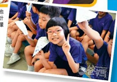
●一、二年級學習飛行原理，他們製作紙飛機後，便會進行班際比賽。