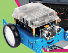
透過學習機械人編程訓練學生的邏輯思維