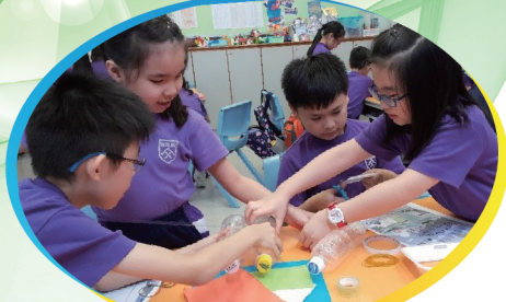
同學們正使用循環再用的膠樽製作木筏