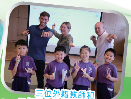
三位外籍教師和 一、三年級飲管飛行器的參賽者們