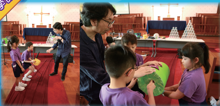
湯博士透過看得見實驗講解飛行的原理